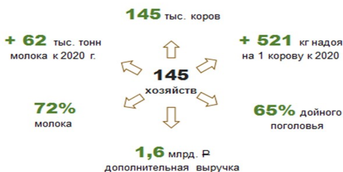
Рис. 4 – Результаты цифровизации молочного скотоводства Республики Татарстан в 2021 г.

В 2021 г. в животноводстве с применением селекционных технологий была создана татарская порода лошадей, разработаны тест-системы для диагностики КРС. В 2022 г. планируется продолжение исследований по разработке вакцины против африканской чумы свиней, белковых кормовых добавок. На молочных комплексах и фермах устанавливают программируемые комплексы управления кормлением и стадом. С цифровыми системами работают 145 хозяйств республики. За прошлый год они обеспечили рост объемов продукции на 62 тыс. т. Дополнительная выручка от реализации молока составила 1,6 млрд руб. (рис.4) [17].