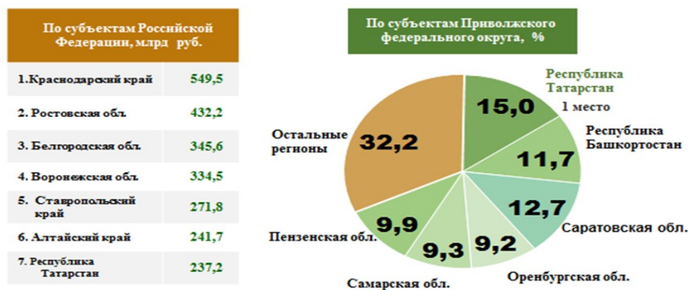
Рис. 1 – Объем валовой продукции сельского хозяйства РТ и занимаемые позиции среди субъектов РФ

Республика Татарстан – один из важнейших сельскохозяйственных регионов России, который за последнее десятилетие по основным макроэкономическим показателям традиционно входит в число лидеров. На территории республики производится 4,3% сельскохозяйственной продукции РФ и 15,0% сельскохозяйственной продукции Приволжского федерального округа, деятельность агропродовольственного комплекса позволяет обеспечить население региона продуктами питания в полном объеме. Из общей площади 6,8 млн га сельхозугодия занимают 4,5 млн га, из них 3,4 млн га составляют пахотные земли. На начало 2021 г. в Республике проживало 3894,1 тыс. чел., трудовой деятельностью в разных секторах экономики было занято 1938,8 тыс. чел., в том числе сельскохозяйственной деятельностью охвачены 142,2 тыс. чел., что в долевого отношении составляет 3,6 % от общей численности населения и 7,3% – занятых в экономике. Объем валового регионального продукта РТ в 2021 г. составил 2903,8 млрд руб., с темпом роста, по сравнению с предыдущим годом, 10,4 % [8,9]. Доля сельского хозяйства в общей структуре валового регионального продукта РТ за 2021г. составила 8,2%, в предыдущие годы она менялась в пределах 8...11%. В целом объем продукции отрасли в 2021 г. снизился к уровню 2020 г. в сопоставимых ценах на 9,1 % и составил 237,2 млрд руб. По производству сельскохозяйственной продукции в 2021 г. Республика заняла 7 место среди субъектов Российской Федерации и 1 место в Приволжском федеральном округе (рис.1) [8].