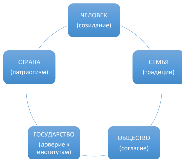
Рис. 2. Модель мировоззренческого пентабазиса

На третьем этапе групповой работы перед участниками была поставлена задача раскрытия ценностных доминант с точки зрения ценностных установок, значимых для подрастающего поколения.