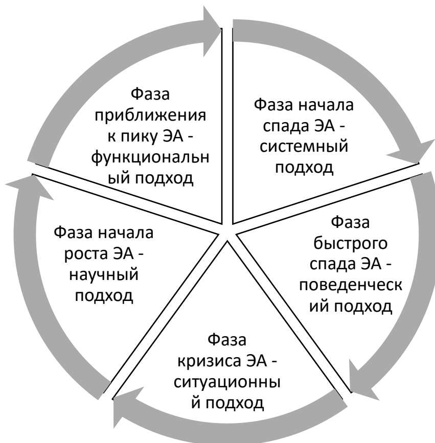
Рис.2. Синхронизация фаз экономической активности в рамках циклов Н.Д. Кондратьева и используемых в рамках циклов К. Жугляра подходов к менеджменту при пятифазной модели развития менеджмента [21].

Очевидным достоинством пятифазной модели развития менеджмента (рис.2) по сравнению с четырехфазной (рис.1) является привязка к историческим этапам развития менеджмента.