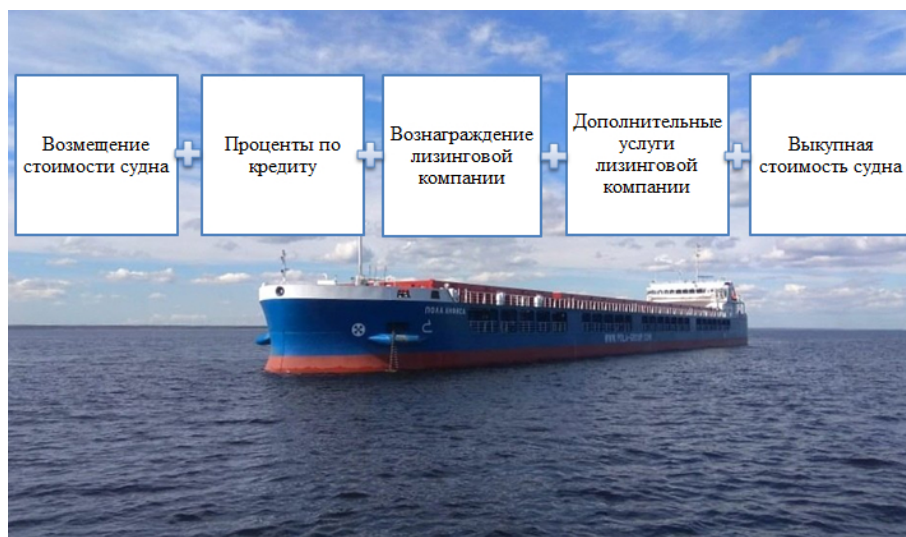
Рис. 2. Структура стоимости приобретения судна в лизинг [7]

Субсидии на покрытие затрат на уплату процентов по кредитам и лизинговым платежам предоставляются в соответствии с Постановлением Правительства РФ от 22.05.2008 № 383 [6].