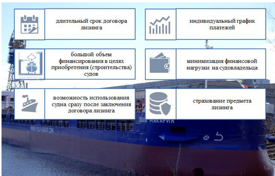
Рис. 1. Преимущества лизинга судов

Порядок расчетов лизинговых платежей для договоров лизинга представлен в Методических рекомендациях. В соответствии с этим документом лизинговые платежи включают амортизационные отчисления за весь срок договора, проценты по кредиту, вознаграждение лизинговой компании, плату за прочие услуги лизингодателя, стоимость выкупаемого имущества (рис. 2) [5].