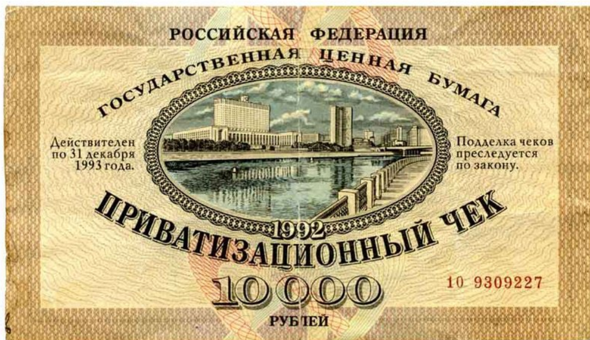
Рис. 4. Приватизационный ваучер (ваучер Чубайса) образца 1992 г.

Вот как вспоминал о чубайсовской приватизации 1992-1994 гг. бывший Председатель комитета госимущества (1994-1995 гг.) В. Полеванов: «...ваучер - это полный обман. Причем тройной» [1] (рис. 5).