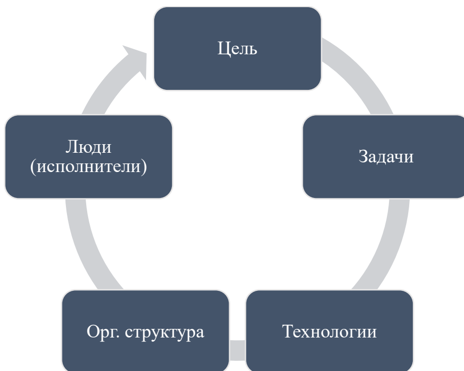
Рис. 3. Ключевые элементы системы менеджмента

При этом А. Чубайс в известной степени лукавит. Поскольку, не забывая о главных поставленных ему (и всему внутреннему топ-менеджменту) целях и задачах, он и его соратники избрали такие технологии их решения (как один из ключевых элементов системы менеджмента - рис. 3), связанные с разграблением госсобственности в интересах обогащения отдельных лиц, получивших фактически даром огромные активы, создаваемые десятилетиями населением страны, что были поражены даже кураторы так называемых экономических реформ.