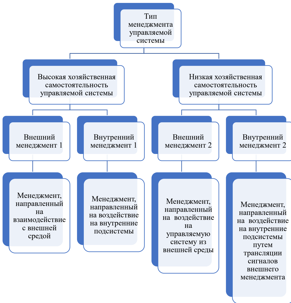
Рис. 2. Классификация типов менеджмента по признаку уровня хозяйственной самостоятельности управляемой системы

менеджеров, протекающие изнутри организации, достаточно подробно расписаны по ролям, например, Г. Минцбергом [3].