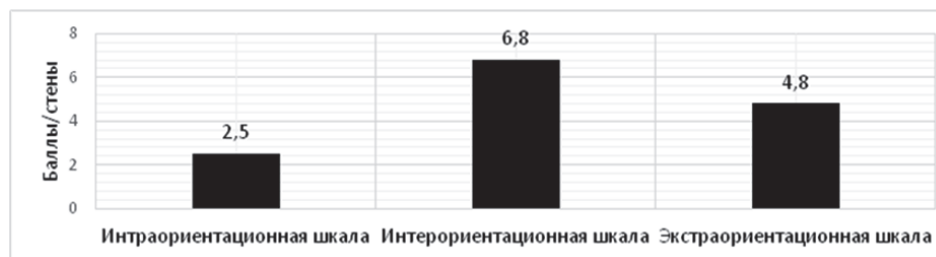
Рис. 2. Средние показатели по шкалам опросника «Профессионально-правомерная направленность»

Представления о себе как о субъекте правоотношений, эмоциональная оценка себя, установки и поведенческие привычки многих студентов — будущих педагогов не связываются с правовым профессиональным поведением: несмотря на то что среднегрупповые показатели по данной шкале входят в диапазон нормального, среднего уровня развития, относительно других шкал, можно говорить о том, что в современной системе высшего педагогического образования проблеме правовой подготовки бу-