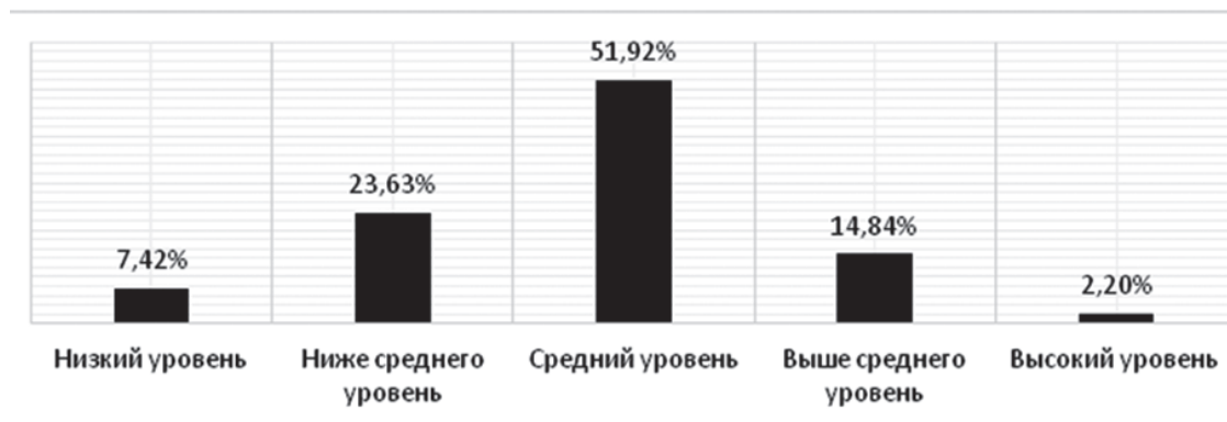
Рис. 1. Процентное распределение будущих педагогов по уровню их правовой осведомленности

Качественный анализ решений студентами предложенных задач показал, что абсолютное большинство будущих педагогов характеризуются стереотипным представлением об отношениях и взаимодействии субъектов образовательного процесса, отражающим их приверженность к авторитарной педагогике: при решении профессионально ориентированных задач студенты часто использовали такие понятия и выражения, как «вызов родителей