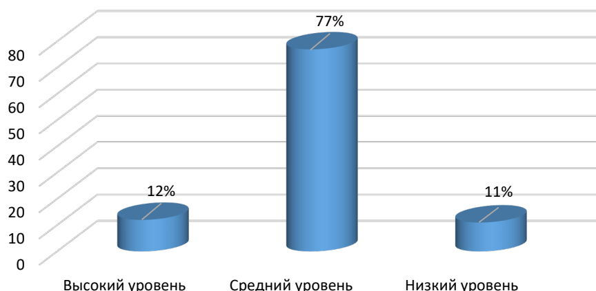
Рис. 3. Уровень патриотической деятельности педагогов

В рамках внутришкольного менеджмента процесса патриотического воспитания было проведено исследование уровня патриотической деятельности педагогов. По итогам тестирования педагогов было выявлено, что преобладает средний уровень патриотической деятельности, что говорит о недостаточной работе в данном направлении и нуждается в дальнейшей работе в этом направлении и пересмотре системы воспитания в школе (рис. 3).