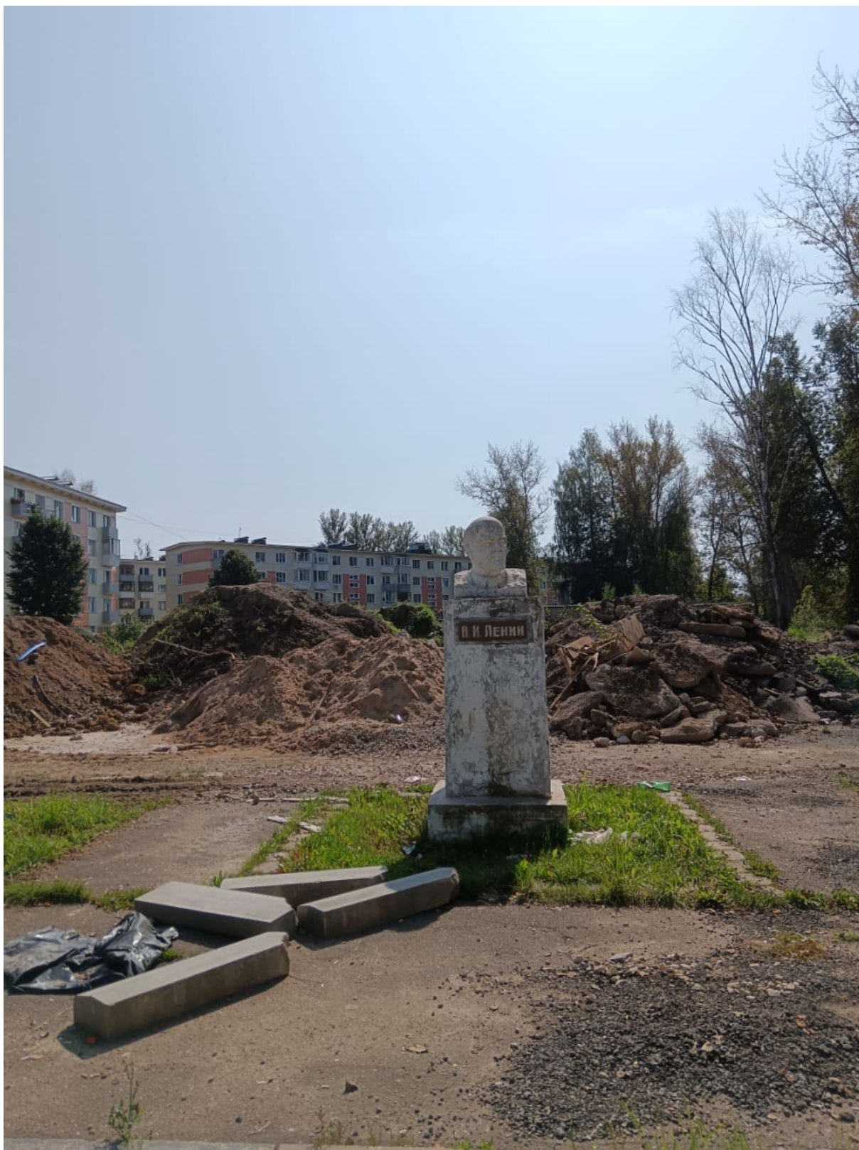
Рис. 3. Пример проблем благоустройства территорий в Московской области

При этом обратим внимание на то, что при ратификации Конвенции ООН против коррупции [58] Российской Федерацией [59] не был включен ряд положений Конвенции [58] (рис. 4).