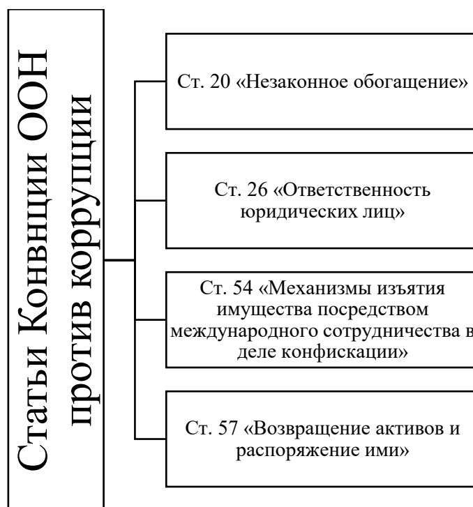
Рис. 4. Статьи Конвенции ООН о против коррупции [58], не включенные в Федеральный закон о ее ратификации (№40-ФЗ от 08.03.2006 г. [59])

При этом 141-е место, которое занимает Российская Федерация в международном рейтинге эффективности государственного управления (Government effectiveness index) [60].