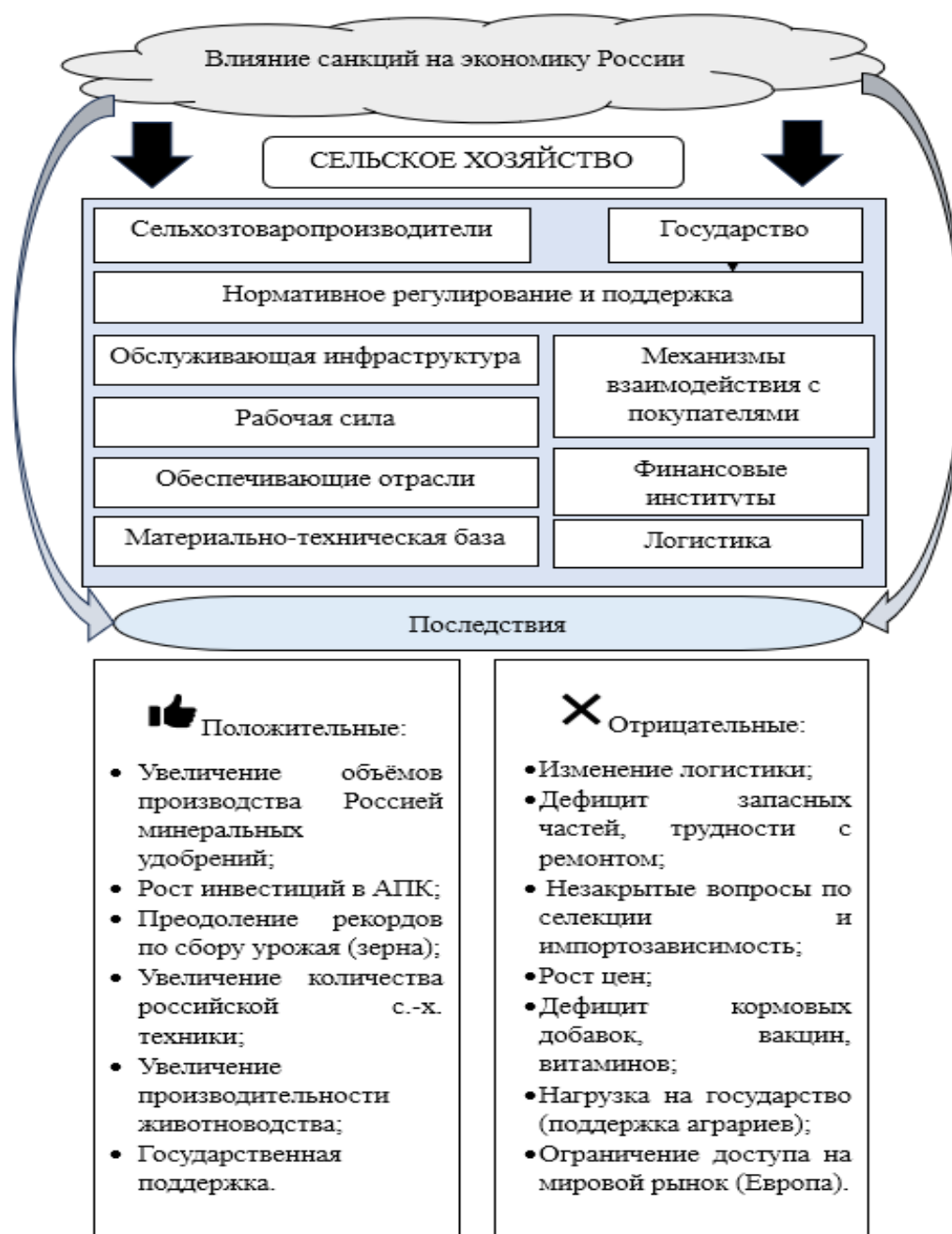
Рис.1. Авторская модель влияния санкций на сельское хозяйство РФ