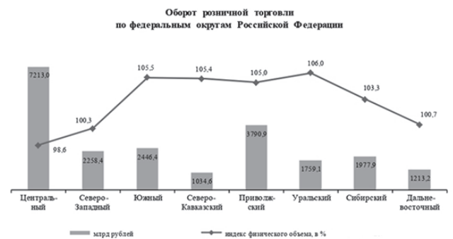
Рис. 2. Показатели федеральных округов РФ по объемам розничной торговли на 2023 г.

Далее проанализируем еще одно актуальное направление — это розничная торговля. Здесь можно наблюдать уже более значительное отставание ПФО от очевидного лидера — мы опять видим в топе ЦФО, однако Поволжье и в данном направлении существенно обгоняет другие округа, что, соответственно, свидетельствует о серьезном и стабильном развитии розничной торговли в субъектах ПФО (рис. 2).