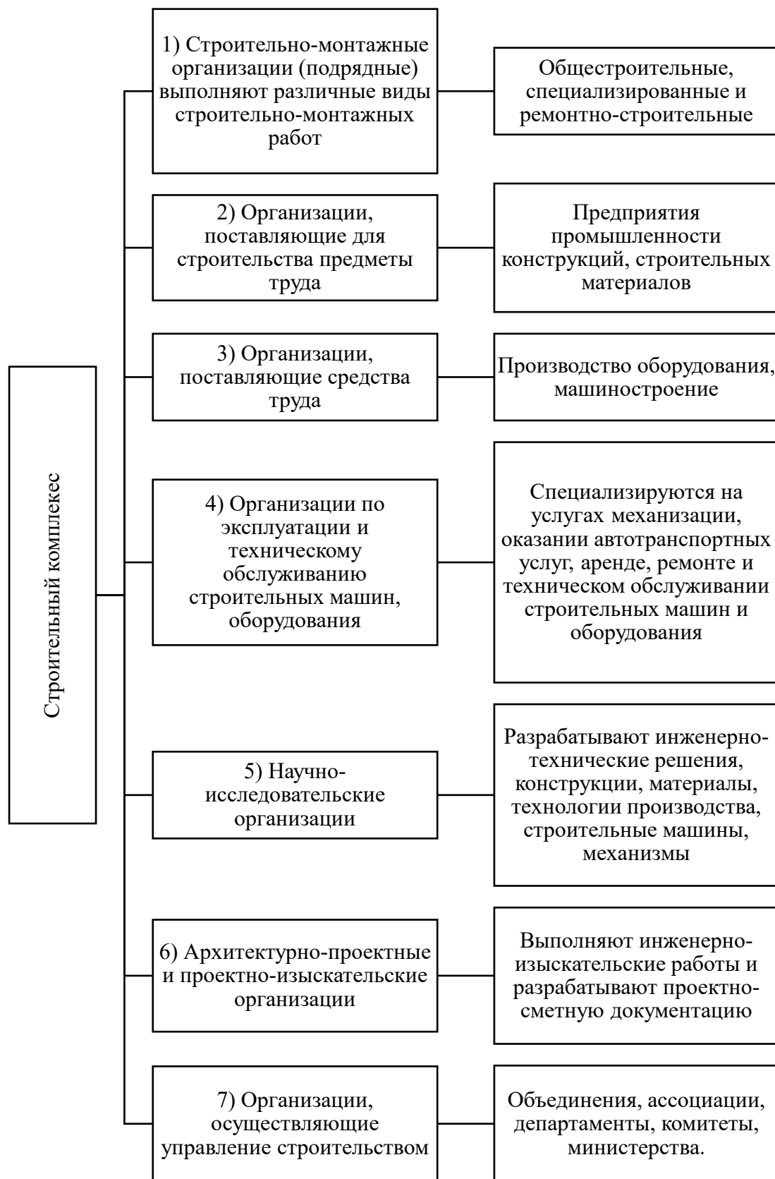
Рис. 3. Группы организаций, представляющие строительный комплекс

При исследовании теоретико-методологических основ формирования строительного комплекса и обеспечивающих его отраслей, обозначенных в первом блоке предложенного алгоритма (рис. 2), будем исходить из состава организаций, формирующих строительный комплекс, представленного на рис. 3.