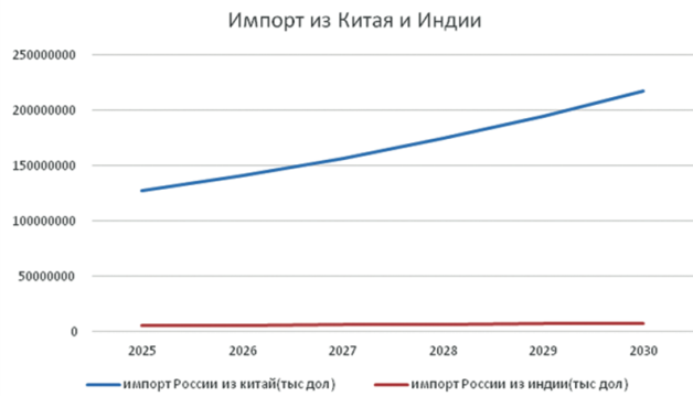
Рис. 4. Прогноз импорта России из Китая и Индии на период 2025–2030 гг., тыс. долл. США

Энергетический сектор сохранит доминирующее положение в структуре российского экспорта в Индию. Помимо традиционных поставок нефти и угля, ожидается наращивание экспорта СПГ, расширение сотрудничества в атомной энергетике, включая трансфер технологий и обеспечение топливом индийских атомных электростанций. Учитывая масштабные инфраструктурные программы Индии, прогнозируется увеличение поставок строительных материалов, металлопродукции и промышленного оборудования. Ведется подготовка к заключению соглашения о зоне свободной торговли между Евразийским экономическим союзом и Индией и обновленного двустороннего межправсоглашения о защите капиталовложений [8]. Существенный потенциал роста демонстрирует экспорт минеральных удобрений, особенно азотных и калийных, необходимых для развития индийского аграрного сектора.