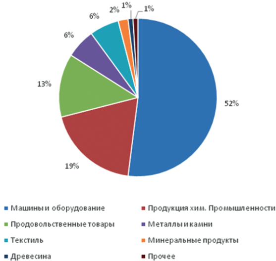
Рис. 2. Товарная структура импорта России в 2024 г. Составлено автором.

Анализируя особенности российской внешнеторговой деятельности, можно отметить устойчиво закрепившуюся специализацию экономических функций, где Российская Федерация преимущественно выступает как экспортер сырьевых материалов и ресурсов, востребованных на глобальном