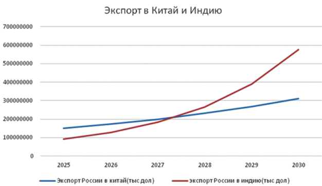
Рис. 3. Прогноз динамики экспорта России в Китай и Индию на период 2025–2030 гг., тыс. долл. США