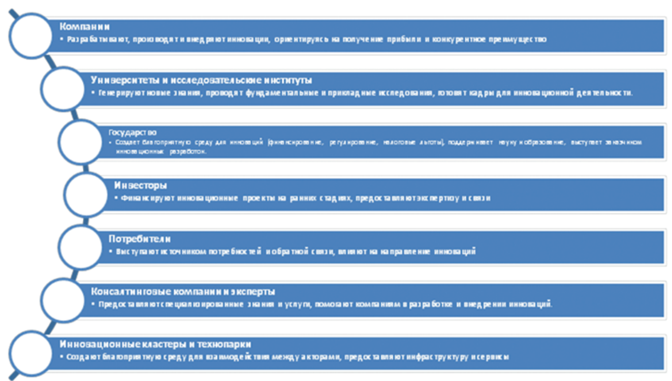
Рис. 1. Основные акторы инновационной деятельности

Е.А. Захарова утверждает, что взаимодействие множества акторов — это ключевой аспект инновационной деятельности. Инновации редко возникают в вакууме; обычно это результат сотрудничества и обмена знаниями между разными участниками [3]. Вот основные формы их взаимодействия: