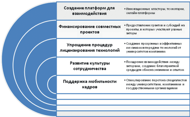
Рис. 2. Методы стимулирования взаимодействия акторов инновационной деятельности

Методы стимулирования взаимодействия акторов представлены на рис. 2.