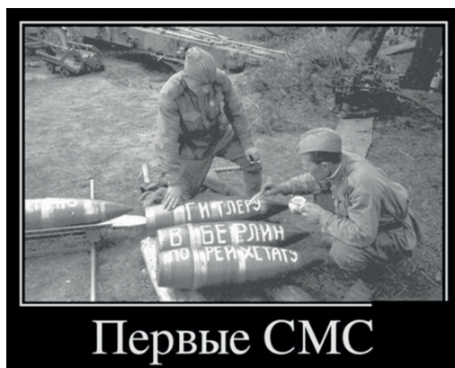
Рис. 4. Осмысление молодежью исторических сюжетов в современных реалиях

С другой стороны, молодежь, активно использующая интернет и социальные сети, часто воспринимает мемы как способ выразить свою ироничную позицию или пародийное отношение к историческим событиям. Для молодых людей мемы становятся инструментом для осмысления истории через менее официальный и более доступный формат, который снимает жесткость традиционных канонов. Тем не менее, для старших поколений это может восприниматься как нарушение установленных традиций и оскорбление памяти, особенно когда мемы касаются исторических героев или священных символов. Эта разница в восприятии, между поколениями, может стать причиной дальнейшего раскола в обществе, где молодёжь и пожилые люди не всегда способны понять друг друга (рис. 4).