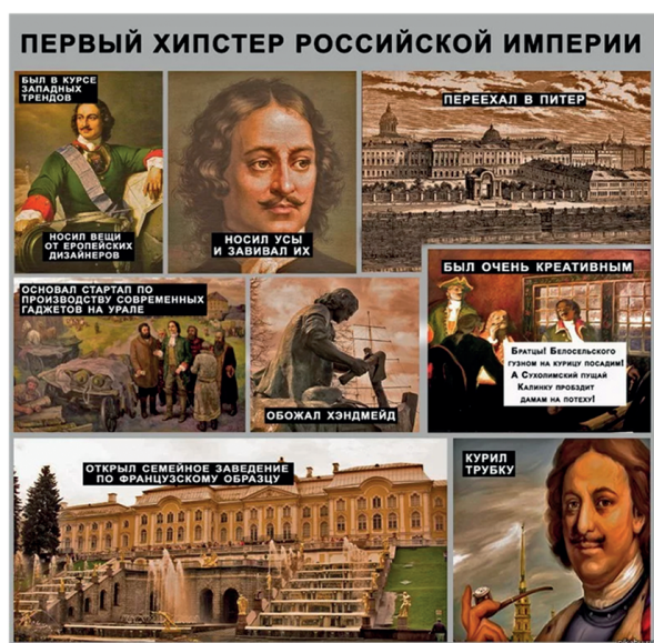
Рис. 1. Современные мемы на исторические темы

национального самосознания, создавая возможность для обсуждения важных тем в неформальной форме, что не воспринимается как идеологические установки (рис. 2).