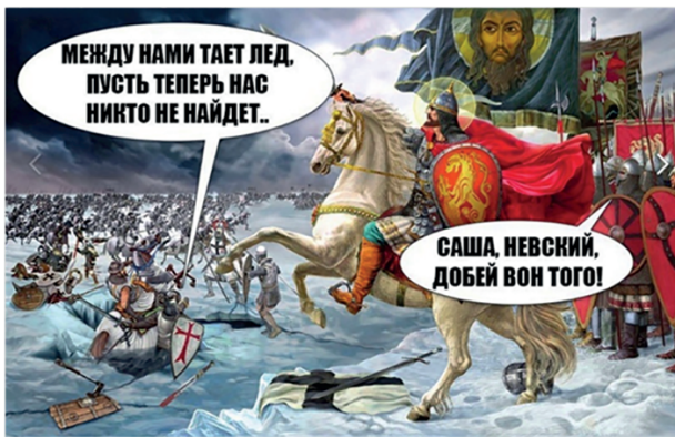
Рис. 5. Осмысление молодежью исторических сюжетов в современных реалиях

ние исторических событий, также сопряжена с серьезными рисками, особенно когда речь идет о патриотических символах. Мемы, являясь удобным и быстрым способом передачи сообщений, обладают большой силой в формировании общественного мнения. Однако они также могут стать инструментом искажения исторической правды и манипуляции политическими изображениями. Часто мемы, упрощая сложные исторические события и факты, исключают важный контекст, что ведет к поверхностному восприятию исторических процессов и значений. Исторические символы, такие как иероглифическая лента или изображения солдат, могут быть использованы не только для выражения патриотизма, но и как элементы политической агитации или коммерциализации, что в свою очередь может привести к утрате их изначального смысла и уважения. Подобная трансформация может искажать историческую память, создавая ложные или упрощенные нарративы, которые легко воспринимаются молодежной аудиторией, не всегда осознающей глубину и значимость этих символов.