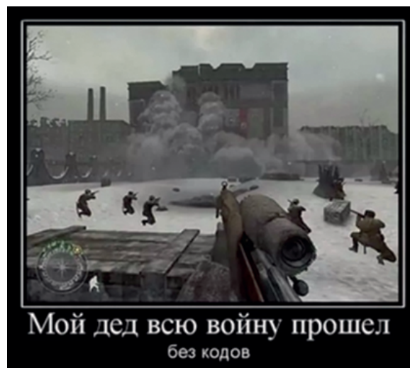
Рис. 3. Мемы о героях ВОВ

исторической памяти массами интернет-пользователей [1].