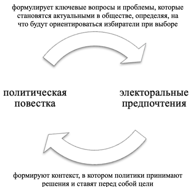
Рис. 1. Взаимосвязь политической повестки и электоральных предпочтений

Кандидаты и партии формируют привлекательную для электората политическую повестку, ориентируясь на текущие электоральные предпочтения в обществе, проблемы и вопросы, волнующие население. Электоральные предпочтения в свою очередь зависят от мнения избирателей по ключевым вопросам политической повестки, которая формируется лидерами партий и политической элитой. Чаще всего избиратели оценивают кандидатов и партии на основании их предложений и решений по вопросам, которые волнуют общество. С другой стороны, политическая повестка определяет основные темы и приоритеты, которые становятся актуальными в рамках, прежде всего, выборов процессов. В целом, можно говорить о том, что взаимосвязь политической повестки и электоральных предпочтений выражается во взаимном влиянии категорий на состояние друг друга (рис. 1).