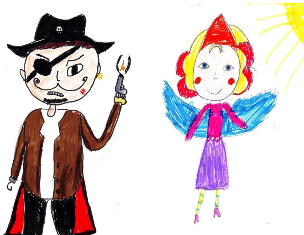
Рис. 1. Образы положительных и отрицательных (злодеев) сказочных героев

На рис. 1 представлены образы положительных и отрицательных (злодеев) сказочных героев, выполненными обучающимися начальной школы.