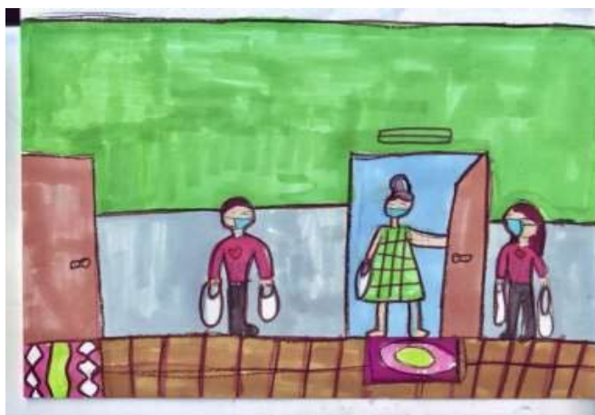
Рис. 2. Рисунок образов добровольцев (волонтеров) в период пандемии COVID-19

На рис. 2 представлена волонтерская деятельность в период пандемии COVID-19, выполненным обучающимися начальной школы.