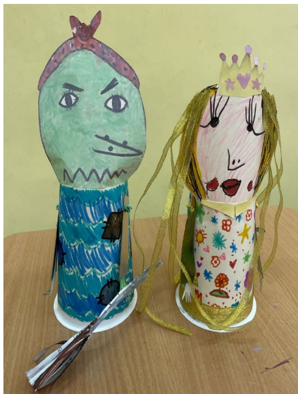
Фото 1. Образы положительных и отрицательных (злодеев) сказочных героев (поделки из бумаги и пластика)

На рис. 1 представлены образы положительных и отрицательных (злодеев) сказочных героев, выполненными обучающимися начальной школы.