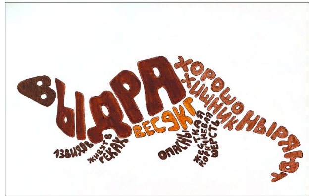
Рис. 3. Животные Московского зоопарка. Шрифтовая композиция

Комментарий к заданию. Выполнение творческой работы ассоциативным шрифтом способствует: развитию у студентов образного мышления, творческого воображения, зрительной памяти, мелкой моторики; формированию грамотности по русскому языку, знаний по естествознанию; систематизации знаний по цветоведению и, учитывая природное сочетание цветов фауны; приобретению устойчивых навыков работы в технике шрифтовой графики (студенты учатся одновременно видеть и образ животного (с учетом анатомических особенностей и пластики), и узнать информацию о нем (в художественный образ вписывается не только название животного, но интересные факты существования и жизнедеятельности выбранного животного), грамотно (без ошибок), удобочитаемо – слева-направо расположить слова, словосочетания, учиться воспринимать реальный и стилизованный вид животного/представителя фауны, что способствует развитию творческого потенциала будущего учителя начальных классов.