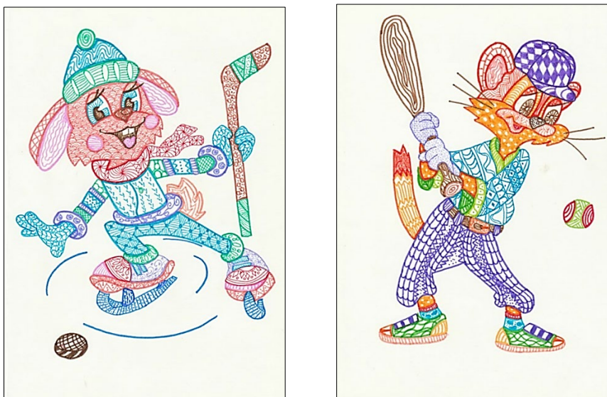
Рис. 2. Герои сказок и мультфильмов. Цветная графика

5. Выполнить работу в технике цветной графики (белый лист бумаги А4, тонкие фломастеры, цветные линеры), используя средства графики (разнообразные средства графики: различные виды линий, множество точек и пятен) и соблюдая гармонию при многоцветии (без использования ахроматических цветов (белый, черный и серые цвета).