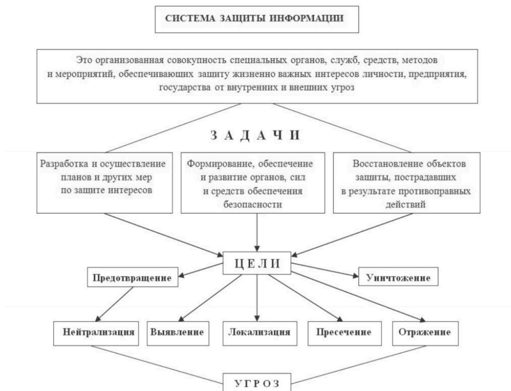
Рис. 1. Система защиты информации [9, с.16]