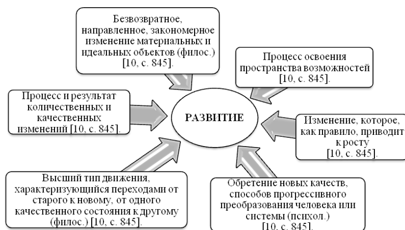
Рис. 1. Дефиниции понятия «развитие»