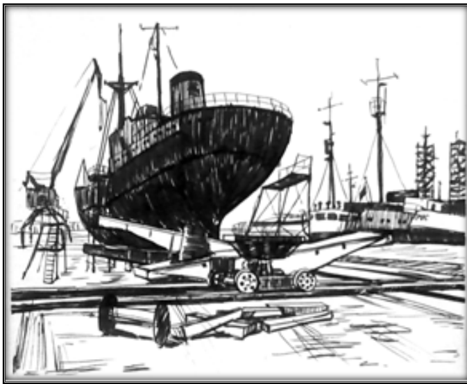
Рис. 1. Типология набросков: 1) линейно-пятновой, 2) линейный, 3) по памяти