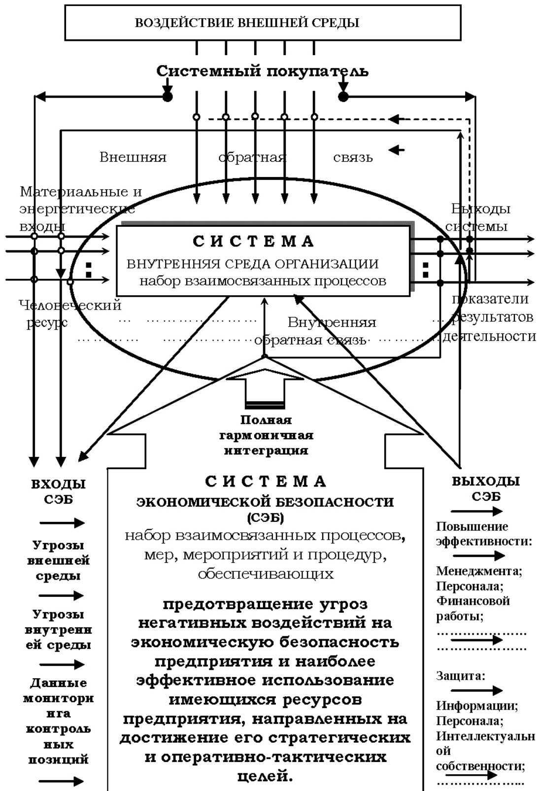
Рис. 2. Взаимодействие системы безопасности с предприятием в терминах системного анализа

Современная концепция управления в полной мере оценивает особый статус этого вида ресурса в сравнении с другими ресурсами [18–22]. Так, например, в [108] отмечается: «людские ресурсы должны не только быть неисчерпаемыми, но и ав-