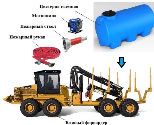
Рис. 3. Форвардер с пожарными опциями

В качестве этих гидравлических элементов могут выступать временно отсоединенные напорные магистрали и сливные трубопроводы компонентов технологического оборудования, не задействованные в режиме водной насосной станции. Например, протяжные вальцы (рябухи) харвестерной головки. Для примера на рис. 4 представлен внешний вид и приведены технические характеристики возможного погружного насоса «Hydra-Tech S12M» [14] для харвестерной головки.