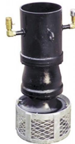
Рис. 4. Погружной насос «Hydra-Tech S12M»

расстояние в сторону воды и заглубление его в водоем. От насоса на берег выходит отводной рукав (рис. 2).