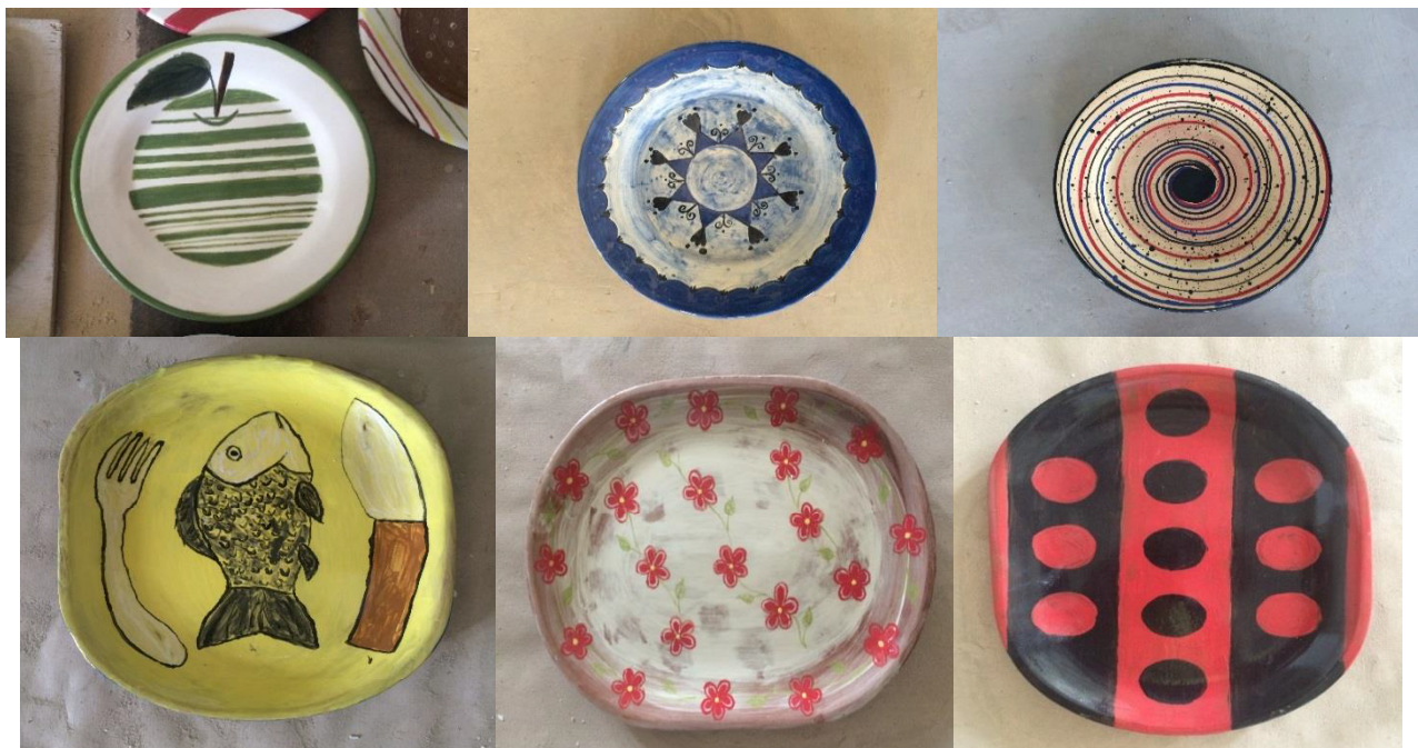
Рис. 5. Ангобная роспись керамической посуды