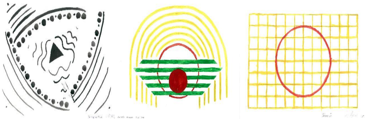
Рис. 1. Упражнение на тему «Композиция на плоскости»

помощью ритмических рядов»[6] имеет цель – овладеть первичными моторными навыками макетирования и изучить метро-ритмические закономерности.