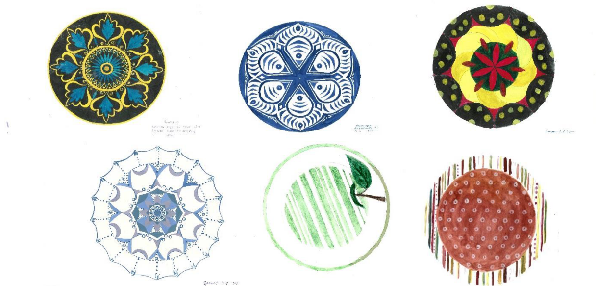
Рис 4. Учебный эскиз росписи керамической тарелки

«Субъективный характер может проявляться по-разному: в пропорциях, в интерпретации форм, в предпочтении, например, контрасту светлого и темного, в линиях, текстурах, колорите и нередко в сочетании всех этих особенностей художественной выразительности вместе» [7].