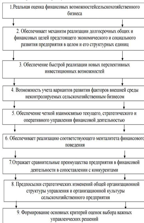
Рисунок 2 – Финансовая стратегия и его возможности

Важную роль в обеспечении эффективного развития предприятия играет разработка специалистами управленческого учета финансовой стратегии (рисунок 2).