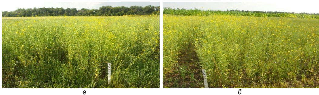
Рис. 1. Посевы ярового рапса, фаза «цветение и плодообразование»: а – гербицидный пар; б – стерня пшеницы

Анализ структуры урожая ярового рапса за 2015-2016 гг. показал, что количество растений к уборке на 1 м 2 составило в среднем 135-184 шт. (контроль, без десикации), 138-192 шт. (с десикацией). Самые высокие растения (103,9-110,4 см) на посеве по гербицидному пару (табл. 2).