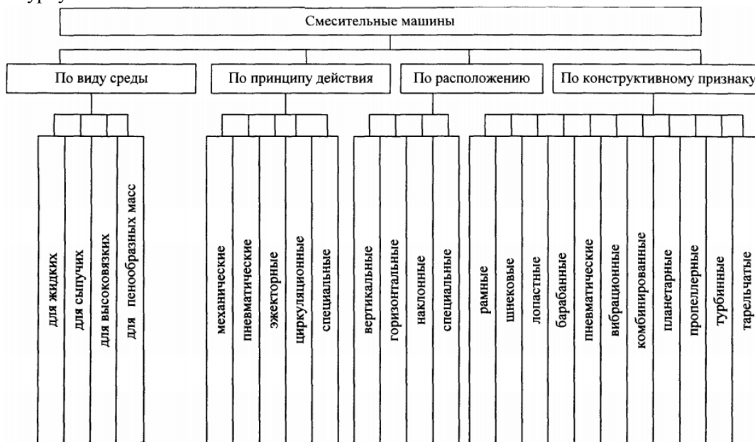
Рис. 1. Классификация смесительных машин для современных производств СССР

время от 15 до 30 секунд, такое же время требуется для оседания частиц после окончания работы пневмосмесителя [13]. Постоянная аэрация смеси во время смешения улучшает ее формуемость и уплотняемость, разрешает готовить высокопрочные смеси до 2 МПа при сохранении производительности смесителя [7]. Существуют несколько видов современных пневмосмесителей (рис. 2) [1].