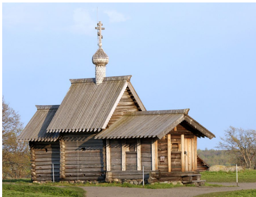
Рис. 2. Церковь Воскрешения Лазаря в музее-заповеднике «Кижь»

Далее уже в середине XX в. был разработан проект реставрации А.В. Ополонниковым, который затем и был осуществлен. Церковь также сильно пострадала от грибка.