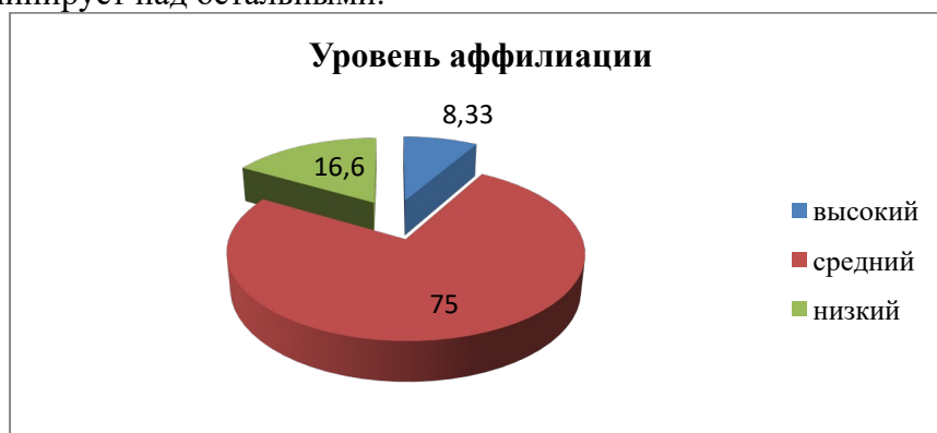
Рис. 1. Уровень аффилиации студентов-бакалавров, будущих учителей начальных классов - инклюзивных педагогов, n=24

совместной деятельности с другими людьми, в сплочении с ними видит один из главных смыслов собственной жизни. Иногда эта потребность становится для человека настолько значимой, что доминирует над остальными.