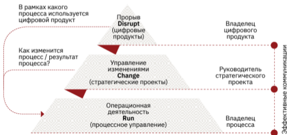
Рис. 2. Использование тримодальной концепции на примере работы Счетной палаты РФ