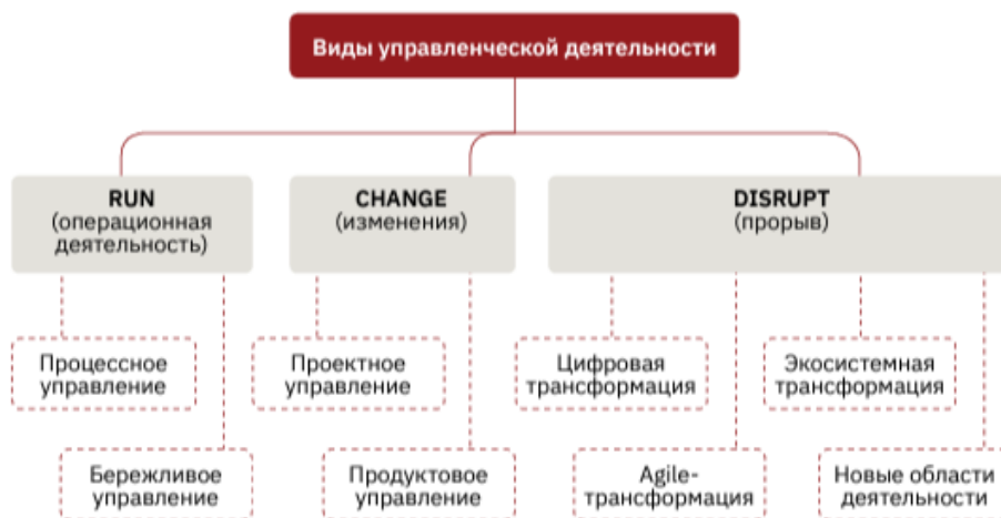
Рис. 1. Тримодальная модель организации управленческой деятельности

«Change» способствует формированию способности гибкости, мобильности и умению работать в команде.