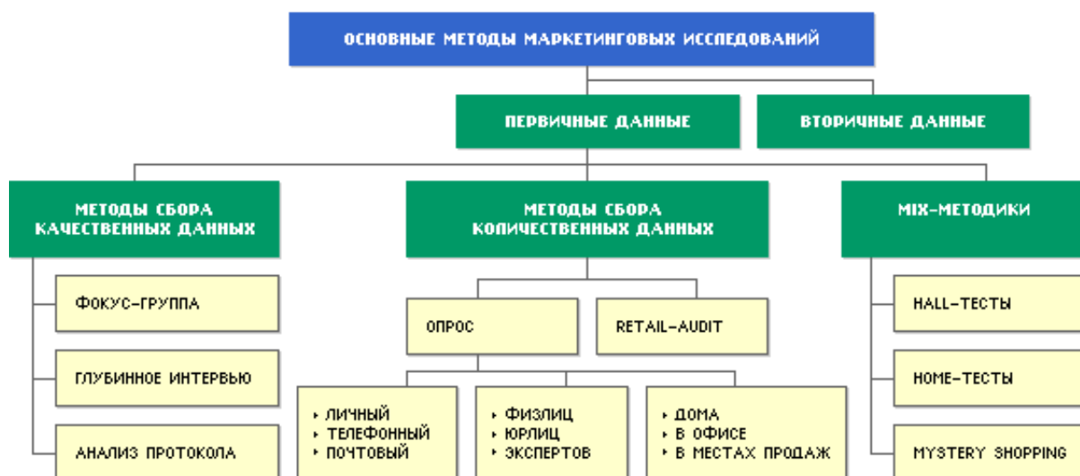
Рис. 2. Классификация маркетинговых исследований, осуществляемых на основе сбора данных различными методами

Результаты систематизации методов маркетинговых исследований на основе сбора и обработки количественных и качественных данных (рис. 2) показали, что методическую основу принятия управленческих решений при осуществлении маркетинговых исследований составляют общенаучные, аналитико-прогностические методы, специализированные методы и методические приёмы, заимствованные из других областей знаний, представленные в табл. 3.