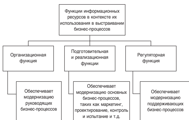
Рис. 1. Функции информационных ресурсов (составлено автором)

Как правило, бизнес-процессы деятельности организации подразделяются на руководящие, основные и поддерживающие. Соответственно, информационные ресурсы должны выполнять следующие функции, представленные на рис. 1, составленном автором (основой выделенной на рисунке классификации выступает опора на виды бизнес-процессов, что является попыткой расширения характеристик информационных ресурсов с включением контекста деятельности предприятий).