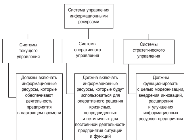
Рис. 3. Схема проектирования систем управления информационными ресурсами (составлено автором)

Исходя из такой логики, целостная система управления информационными ресурсами должна формироваться в трех направлениях, представленных на рис. 3, составленном авторами.