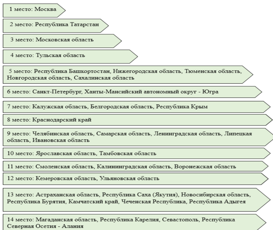
Рис. 3. Топ регионов национального рейтинга состояния инвестиционного климата в субъектах РФ по итогам 2022 г.

(по данным Агентства стратегических инициатив)