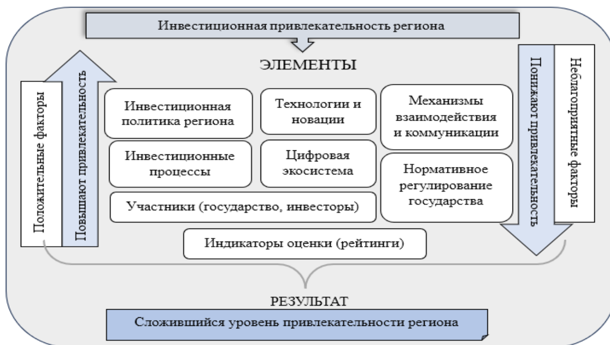
Рис. 5. Авторская версия экономического механизма инвестиционной привлекательности региона

Формирование инвестиционной привлекательности невозможно без тесного взаимодействия всех участников и элементов этого процесса (рис. 5). Только слаженная работа, грамотное управление и учёт лучших практик из других регионов помогают создавать благоприятный климат в регионах [9].