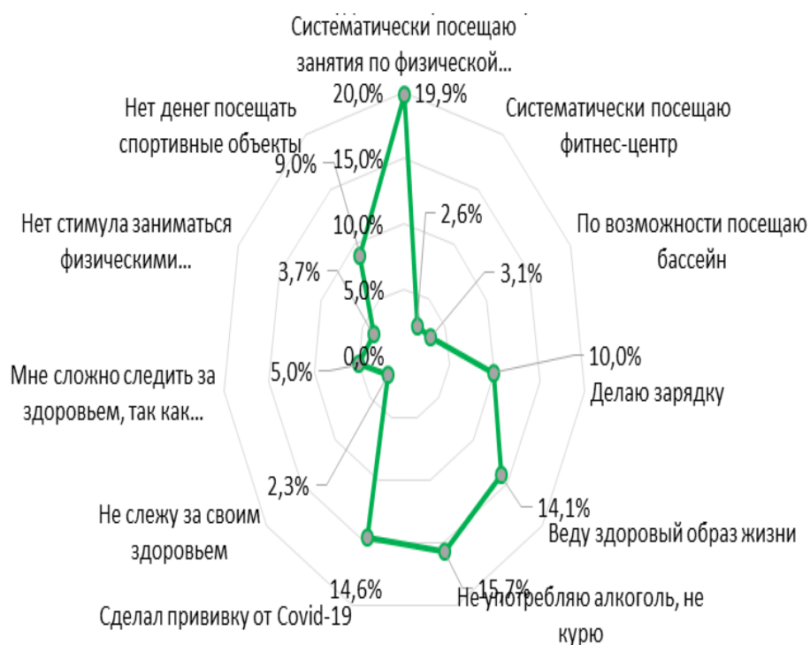
Рис. 5. Как поддерживают уровень своего здоровья студенты

Следующий вопрос, на который предлагался ответить студентам: «Как вы поддерживаете свое здоровье?», почти все опрошенные считают, что уровень здоровья напрямую влияет на качество жизни. Для поддержки здоровья только 19,9% не пропускают занятия по физической культуре, ведут здоровый образ жизни 14,1%, не употребляют алкоголь, не курят 15,7%, делают зарядку 10,4% (рис. 5).