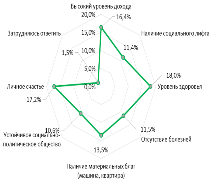
Рис. 3. Что подразумевают под качеством жизни студенты

Анализ оценок студентов влияния уровня здоровья на качество жизни, показал, что большинство студентов вуза считают, что уровень здоровья напрямую влияет на качество жизни: 92,9% (рис. 4).