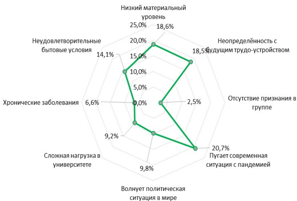
Рис. 2. Анализ оценок студентами обстоятельств, которые, по их мнению, снижают качество жизни

На вопрос – «Что Вы подразумеваете под качеством жизни?», большинство студентов основными составляющими являются два показателя: быть успешным во всех сферах жизни и быть здоровым. Следующую позицию по значимости занимают два показателя: возможность хорошо трудоустроиться и большое количество денег. Наименее значимым для студентов является аспект спутника жизни (найти свою вторую половину). Минимальная доля студентов (1,8% и меньше) затруднились определить приоритет по значимости показателей качества жизни. Мы наблюдаем, что качество жизни полностью устраивает 16,9% студентов и 59,4% хотят иметь более высокое качество жизни, чем сегодня.