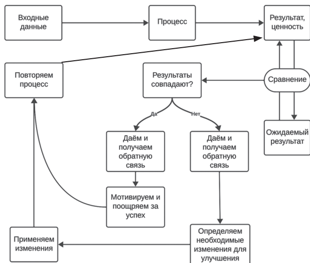
Рис. 2. Применение обратной связи для улучшения способа получения ценности

и подчиненным, с тем чтобы скорректировать их поведение на ожидаемое, «забираем» обратную связь от сотрудников, чтобы найти проблемы и понять, где можно предложить улучшение.