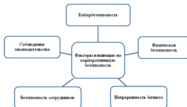
Рис. 1. Факторы, влияющие на корпоративную безопасность [6]

Постоянная потребность в корпоративной безопасности обусловлена сложным и постоянно меняющимся ландшафтом, в котором работает бизнес. Понимание этих факторов и внедрение эффективных мер противодействия имеет решающее значение для любой организации, стремящейся к процветанию. На рис. 1 приведен перечень некоторых ключевых факторов, которые могут повлиять на корпоративную безопасность компаний.