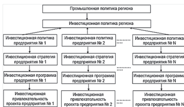
Рис. 3. Место инвестиционной составляющей в структуре региональной промышленной политики

Так как в условиях рынка инвестиции играют определяющую роль, то, соответственно, они являются основным элементом в региональной промышленной политике. Она формируется на базе аналогов субъектов хозяйствования данного территориального образования, включая государственные организации и учреждения [10].