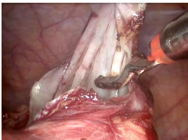
Рис. 3. Иссечение стенок кисты до границы с паренхимой почки.

резецированный участок оболочки подлежал гистологическому исследованию (рис. 3).