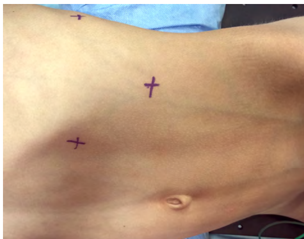
Рис. 1. Места введения троакаров у больного в положении Симса: по передней подмышечной линии ниже рёберной дуги на 2–3 см, по среднеключичной и по задней подмышечной линиям на 2–3 см ниже рёберной дуги.

Операция осуществлялась в положении больного по Симсу. Для выведения почки в подрёберной области под больного укладывается поперечный валик. Его размеры индивидуальны и зависят от возраста ребёнка. Первым и при этом, возможно, важнейшим и определяющим весь дальнейший ход операции этапом являлась адекватная визуализация участка почки с кистой с введением рабочих троакаров (рис. 1).