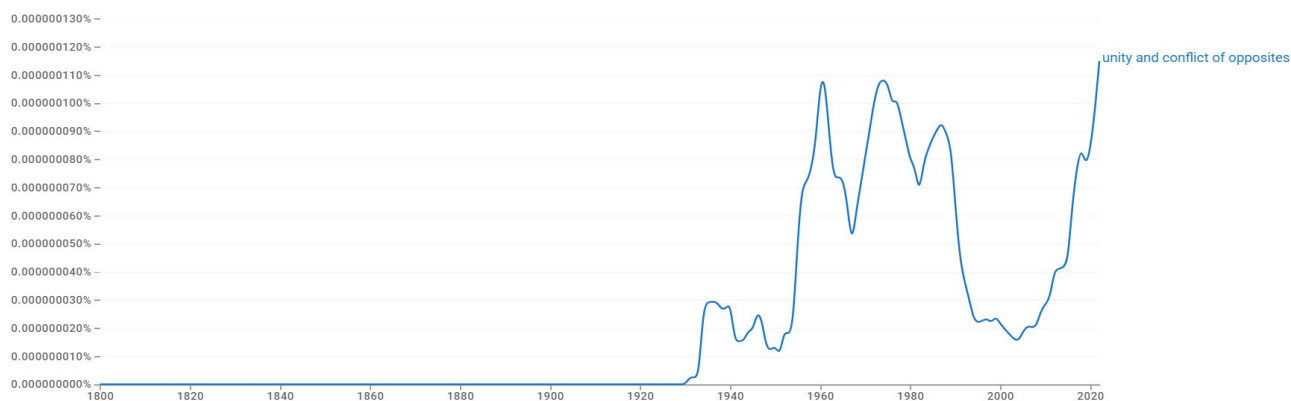
Рис. 4. «Unity and Conflict of opposites» в англоязычных текстах с 1800 по 2020 г.

Запрос на поиск аутентичной формулировки закона «Unity and Conflict of opposites» в англофонной литературе дал ссылки на тексты уже 50-х годов XX в. Между тем, как показывает график и это необходимо отметить, интерес к этой формуле в англоязычных текстах резко вырос к началу 20-х годов XXI в., что не может не вызывать беспокойства.