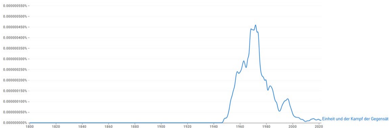
Рис. 3. «Einheit und der Kampf der Gegensätze» в немецкоязычных текстах с 1800 по 2020 г.

в ИМЭЛ, с тех пор как в 20-30-х советским правительством были выкуплены из Европы все подлинные тексты классиков, включая черновики, письма и т.п. [15].