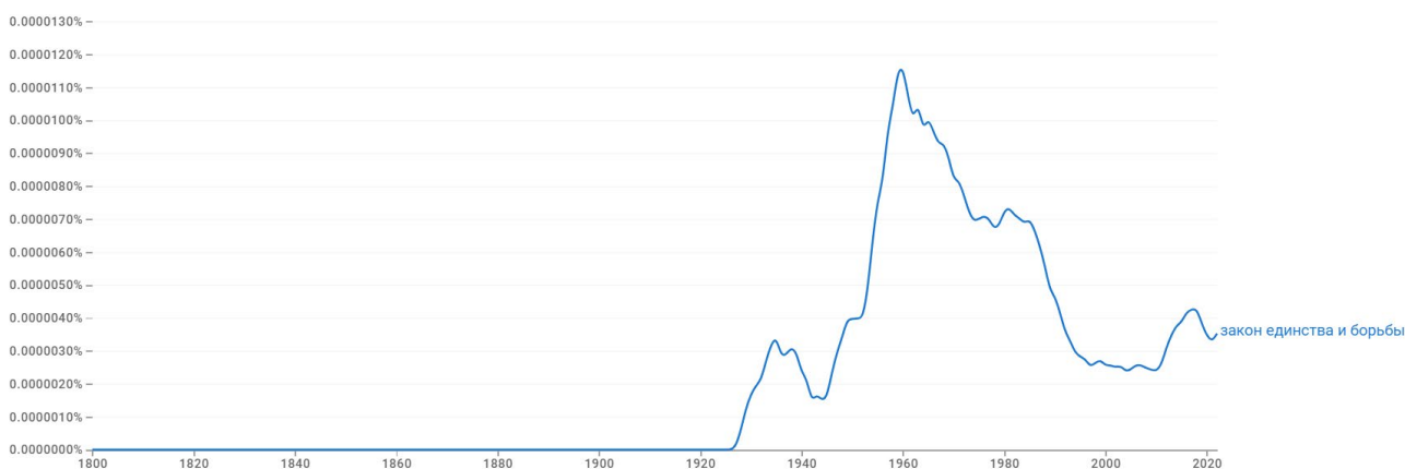
Рис. 2. «Закон единства и борьбы противоположностей» в русскоязычных текстах с 1800 по 2020 г.

Осуществленные в настоящем труде компьютерные исследования текстов в панхроническом конкордансе Национального корпуса русского языка (НКРЯ), а также в поисковом сервисе Google Books Ngram Viewer на русском языке, показали, что, с учётом погрешности, в отечественной литературе синтагма «единство и борьба противоположностей» впервые появляется в источниках не раньше конца 20-х годов XX в.