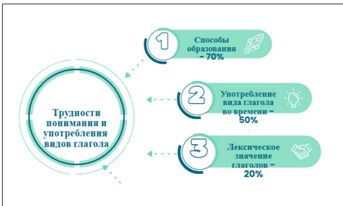
Рис.1. Трудности понимания и употребления видов глагола иностранными учащимися (составлено автором статьи)

На подготовительном факультете обучение видам глагола как одной из функционально значимых тем русской грамматики начинается в середине первого семестра. После прохождения иностранными учащимися таких грамматических тем, как единственное и множественное число имен существительных, прилагательных, личных и притяжательных местоимений глагольные формы, как и сами значения глаголов, изучаются в контексте, отражающей особенности протекания того или иного действия в режиме определенного грамматического времени русского языка.