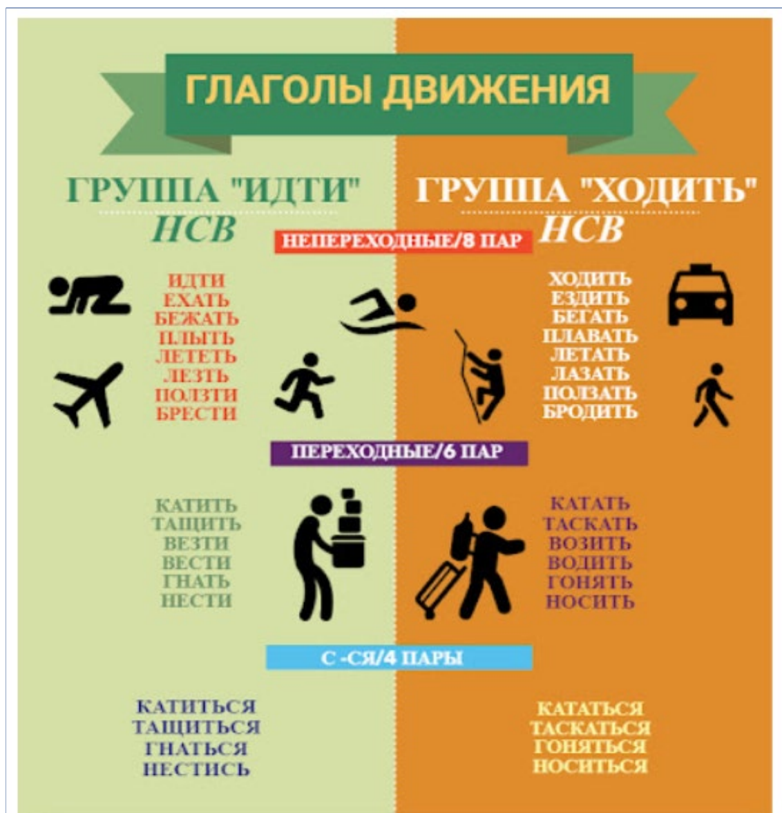
Рис.2. Пример инфографики как дополнительного ресурса при изучении темы глаголов движения с приставками в форме совершенного вида

В современной методике обучения с развитием цифровых образовательных ресурсов получила активное развитие и применение инфографика. Под инфографикой нами понимается некое сочетание вербального и невербального изображения, заключающее в себе лексико-грамматический материал русского языка и способствующий практической отработке в коммуникации иностранных учащихся (см. рис. 2).