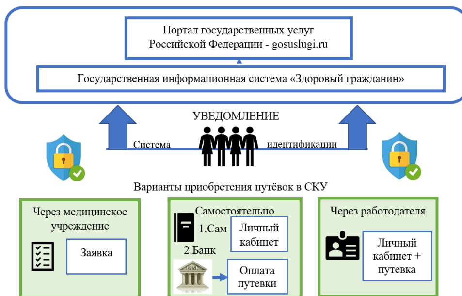
Рис. 4. Модель работы информационной системы «Здоровый гражданин» как элемент контроля в системе санаторно-курортного лечения.