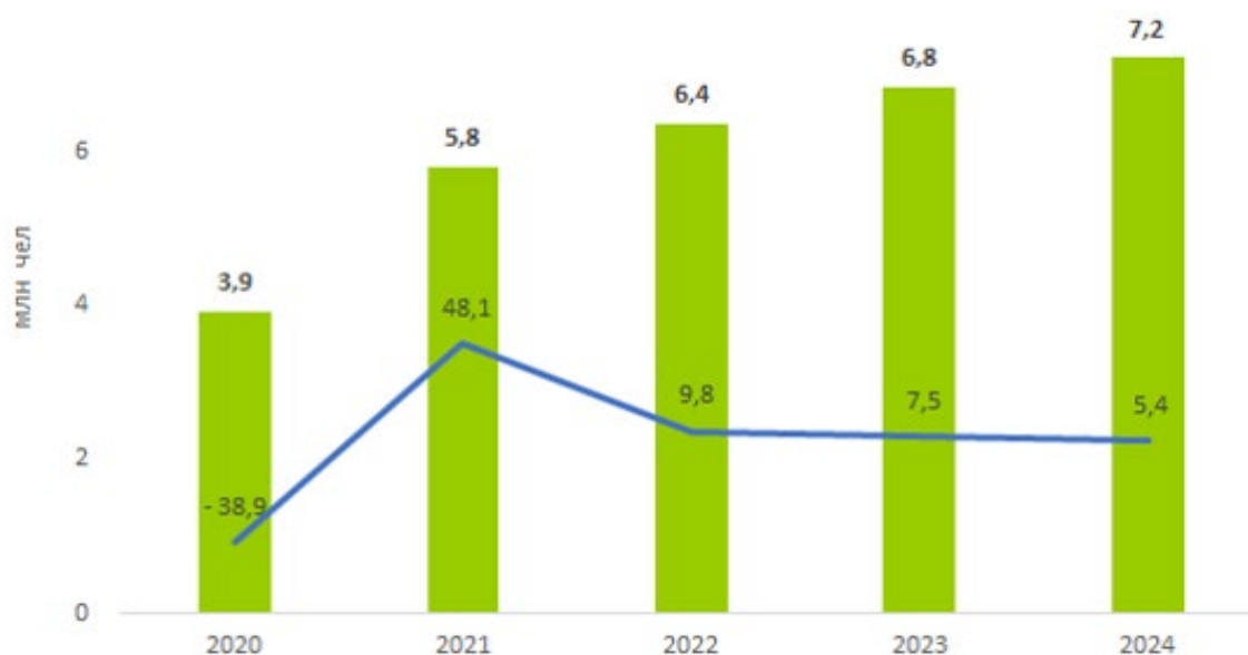
Рис. 1. Численность потребителей санаторно-курортных услуг 2020-2024 гг., млн чел.

Кроме того, рост потребителей обоснован реабилитацией участников СВО и членов их семей (при наличии показаний).