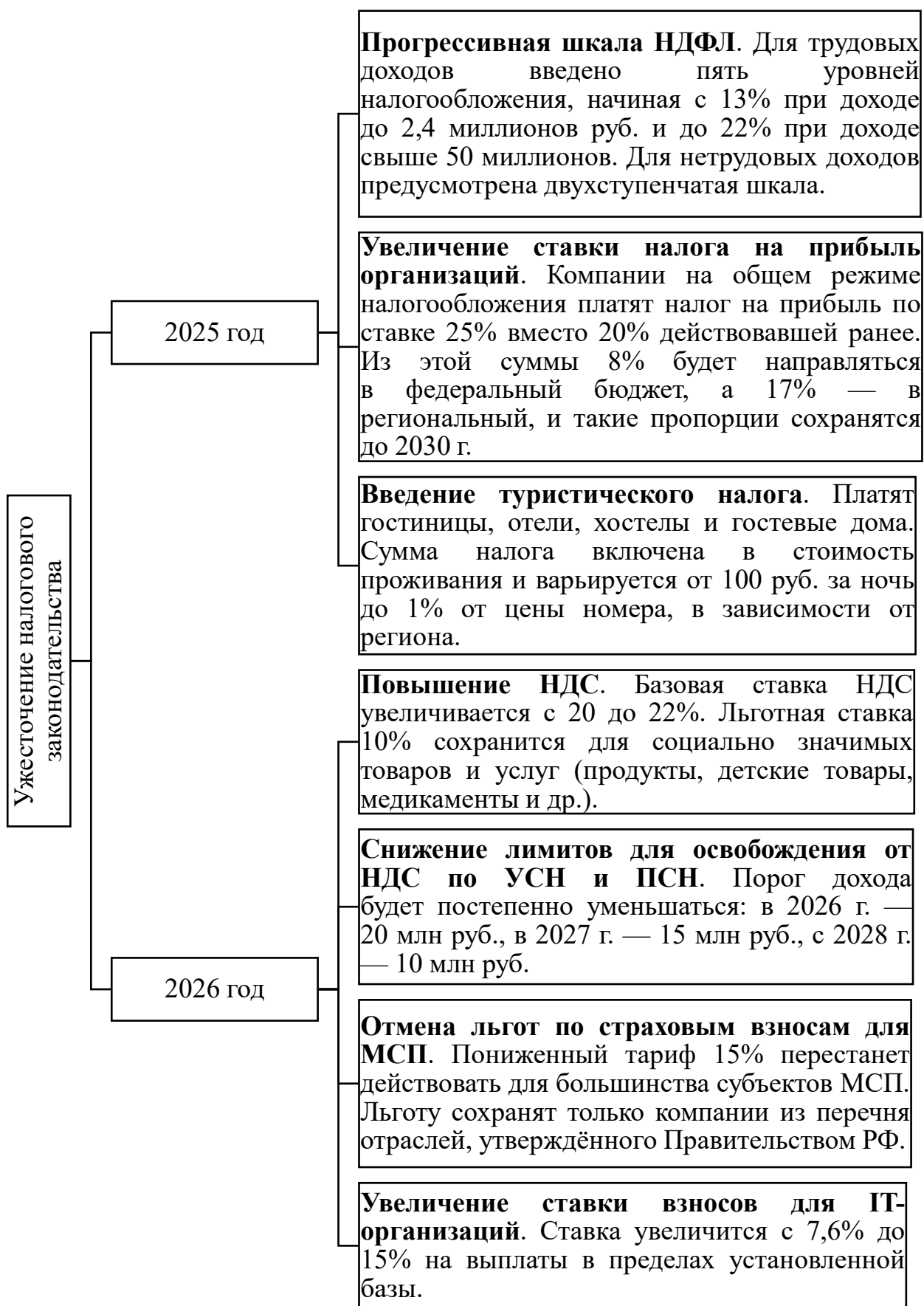
Рис. 1. Некоторые значимые составляющие фискальной нагрузки на бизнес и граждан, претерпевшей изменения в 2025-2026 гг. в Российской Федерации.