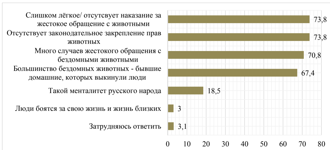
Рис. 2. Причины негуманного отношения россиян к бездомным животным, %

Следующие 23,2% респондентов, считающих, что российское общество скорее гуманно настроено к бездомным животным, причину такого поведения видят в том, что у многих жителей есть домашние животные, которых подобрали на улице (80%), а также то, что в крае много приютов для животных – 25%.