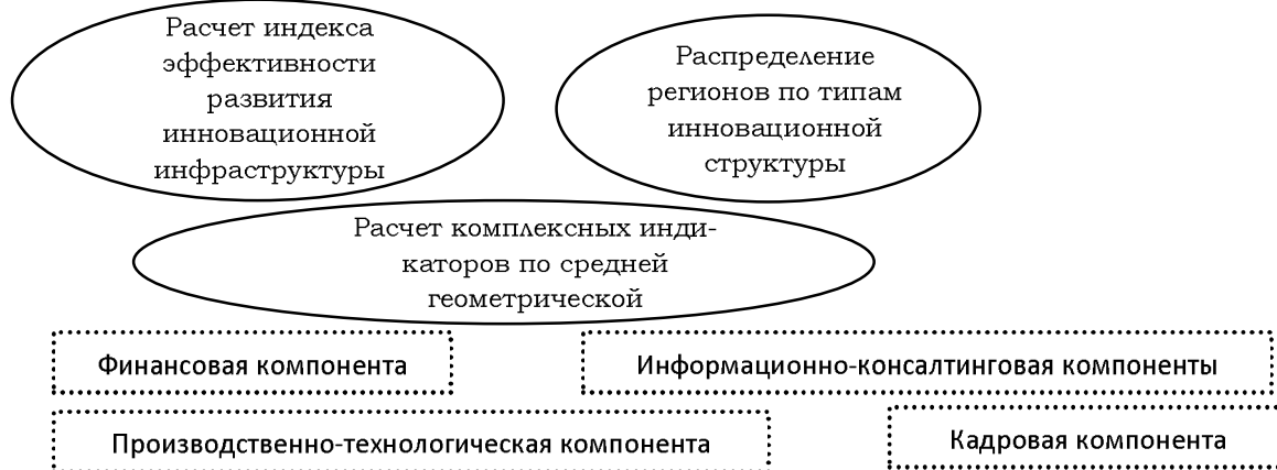
Рис. 2. Совокупные показатели и индексы инновационной инфраструктуры региона.

При оценке инновационного потенциал предприятий следует учитывать влияние раз-