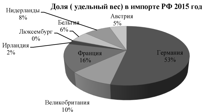
Рис. 5. Доля (удельный вес) в импорте РФ 2015 год

По итогам года импорт тоже снизился. В стоимостном выражении он составил 183,6 млрд долларов, что меньше, чем за прошлый год на 0,3 %.