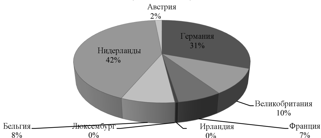
Рис. 4. Доля (удельный вес) в экспорте Российской Федерации 2016 год (млн. долларов США)

По итогам 2016 года экспорт России в стоимостном выражении сократился на 17 % и составил 285,49 млрд. долларов. При этом самые низкие показатели были характерны для января, когда он упал сразу на 37,2 %.