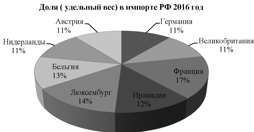
Рис. 6. Доля (удельный вес) в импорте РФ 2016 год

Великобритания (10 %), Нидерланды (8 %), Бельгия (6 %), Австрия (5 %), Ирландия (2 %). Не смотря на то, что доля импорта из Люксембурга очень мала, торговые отношения с этой страной развиваются. Этому свидетельствует стоимостное увеличение импорта в 24,5 %.