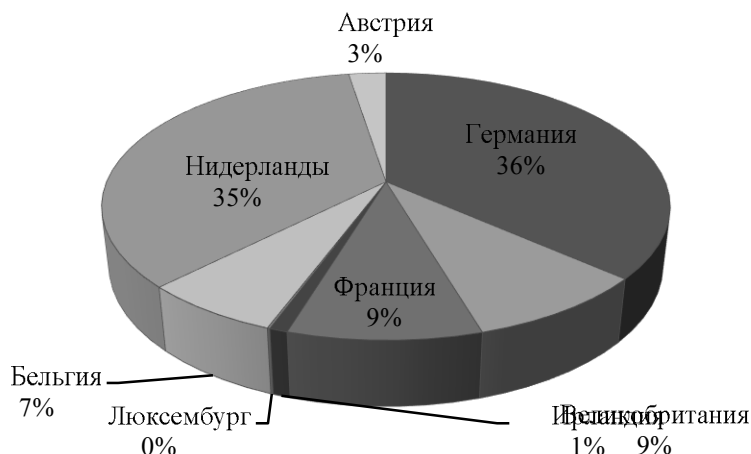
Рис. 1. Внешнеторговый оборот России и стран Западной Европы 2015 год в млн. долл. США

В 2015 году с перевесом лишь в 1% лидером среди стран Западной Европы в более тесных торговых отношениях замечена Германия (36%),