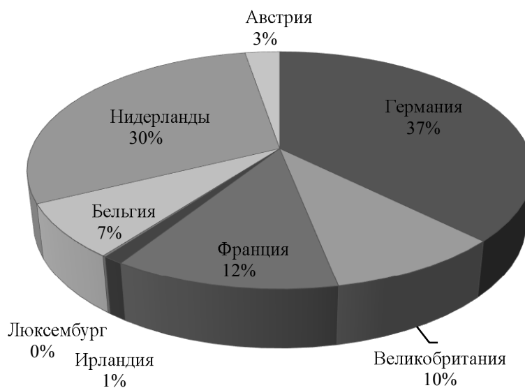
Рис. 2. Внешнеторговый оборот России и стран Западной Европы 2016 год в млн. долл. США

В 2016 году свою лидирующую позицию не уступает Германия, но уже в 37 %. Затем также Нидерланды, но с менее львиной долей, нежели в прошлом году (30 %). Ни смотря на продление санкций Франция увеличила обороты с 9 до 12 %, а Великобритания до 10 %. Неизменно свою нишу занимают: Бельгия, Ирландия и полный аутсайдер – Люксембург.