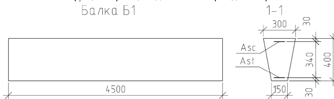
Рис. 1. Геометрические размеры исследуемых железобетонных образцов

В качестве исследуемых приняты балочные элементы трапециевидного сечения пролетом 4,5 м, высотой 400 мм, с шириной верхней и нижней граней, соответственно, 300 и 150 мм. Геометрические размеры рассматриваемых элементов приведены на рис. 1.