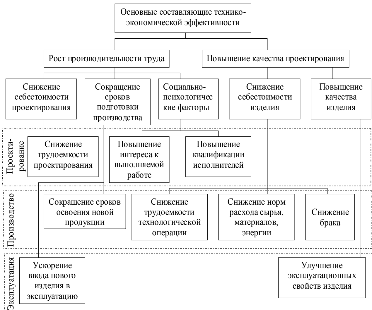
Рис.5. Факторы технико-экономической эффективности модернизации производственного процесса [2]