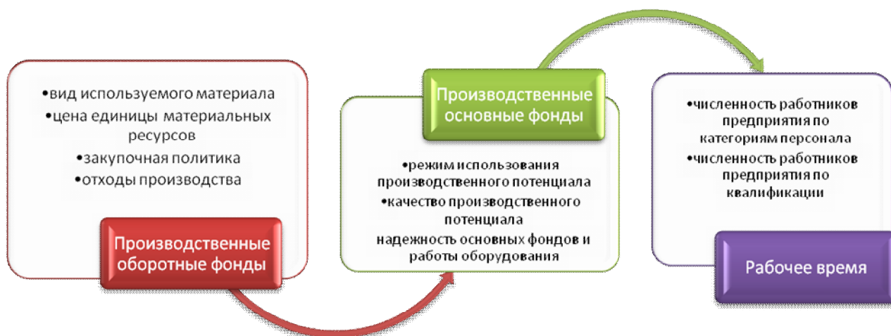
Рис. 3. Причины возникновения риска снижения конкурентоспособности продукции и факторов производства

Техническое развитие предприятия дает возможность расширить производственный потенциал и обеспечивать воспроизводство его основных фондов (начиная с капитального ремонта и заканчивая новым строительством). С одной стороны, необходимо поддерживать технико-технологическую базу предприятия, а с другой – моделировать ее непосредственное развитие путем усовершенствования и наращивания (рис. 4).