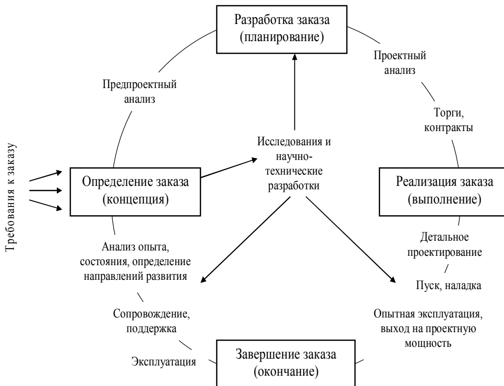
Рис. 2. Концептуальная схема жизненного цикла заказа [2]