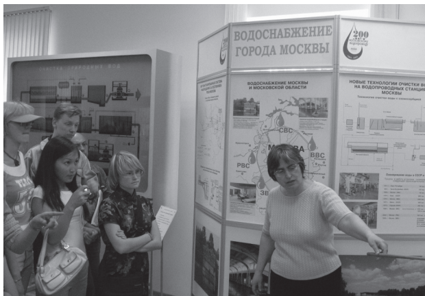
Рис. 3. Музей воды