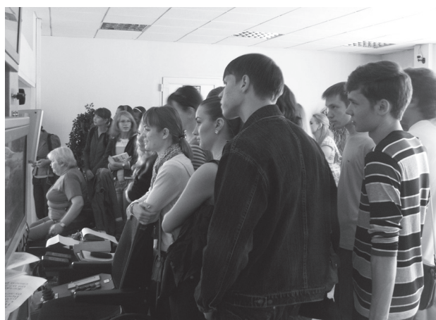
Рис. 1. Завод №2 по термическому обезвреживанию твердых бытовых отходов ГУП «ЭкоТехПром»

кументация, необходимая для подготовки отчетов по практике. В компьютерном классе кафедры студенты имеют доступ и активно пользуются электронной законодательно-правовой базой «Консультант», материалами научной электронной библиотеки ( http://elibrary.ru ), различными программами. Качество подготовки отчета (его структура, полнота, новизна, количество использованных источников, самостоятельность при его написании, степень оригинальности, решений, обобщений и выводов), а также уровень доклада (акцентированность, последовательность, убедительность, использование специальной терминологии) учитывается при выставлении дифференцированной оценки.