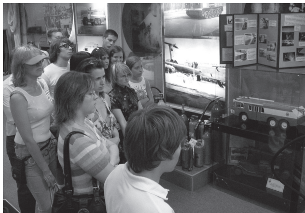
Рис. 4. ЦУКС ГУ МЧС РФ по г. Москве

ситуациями» ГУ МЧС РФ по г. Москве (ЦУКС ГУ МЧС РФ) и другие объекты (рис. 3, 4).