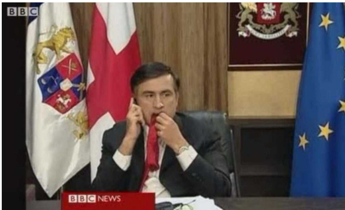
Рис. 2. Инцидент с галстуком 13