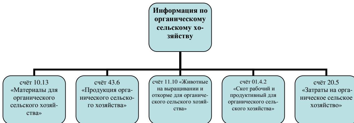
Рисунок 14 – Источники информации по органическому сельскому хозяйству: счета бухгалтерского учёта