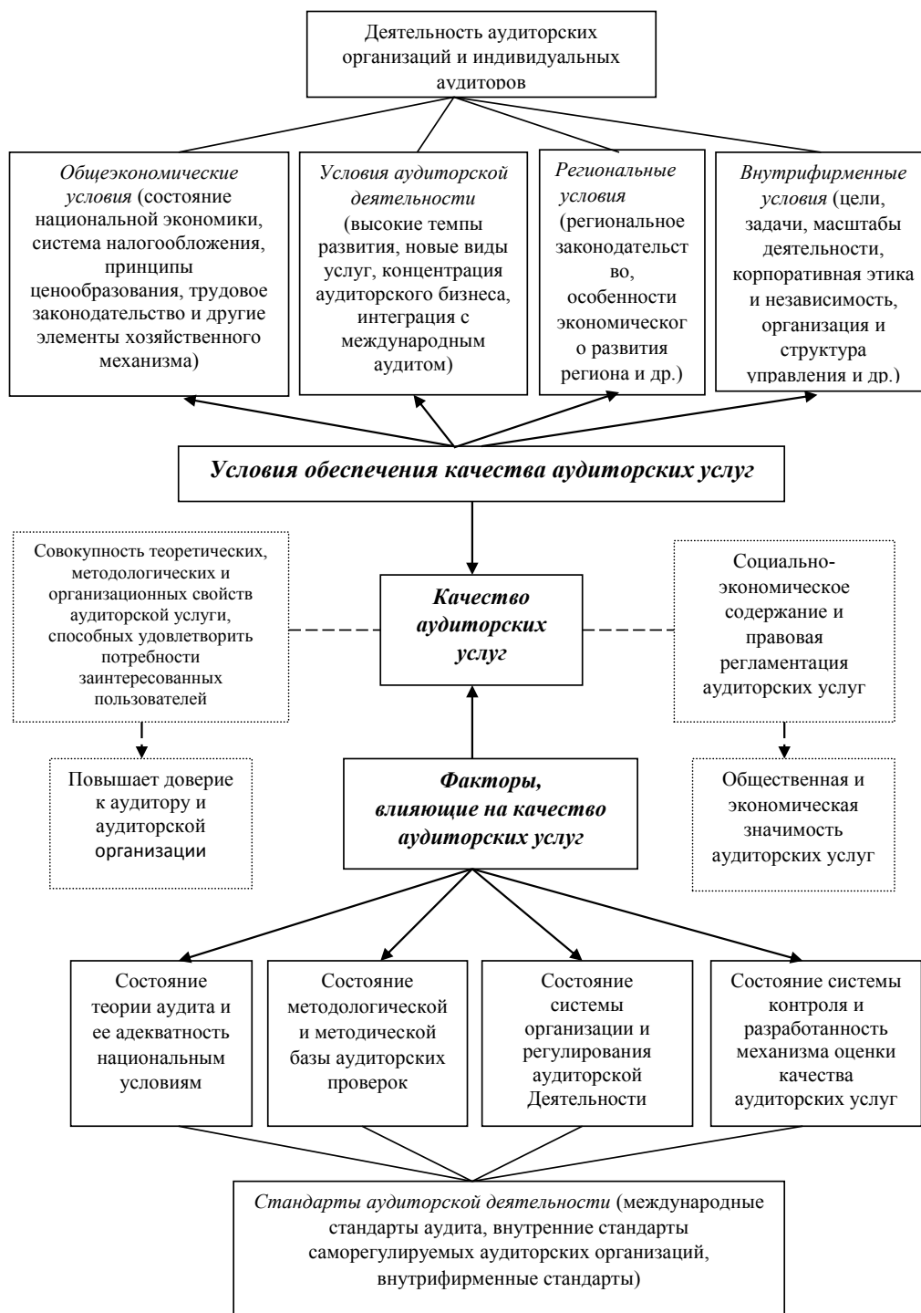
Рис. 1. Формирование качества аудиторских услуг

ектов Российской Федерации, особенностями экономического развития региона. Это относится, прежде всего, к мерам поддержки малого и среднего предпринимательства со стороны региональных органов власти, наличию или отсутствию свободных экономи-